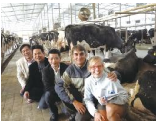
昆山向阳乳业牧场里清洁明亮的牛舍