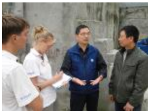
天淇牧场青贮窖外的访问交流

地处热带雨林的巴西经常下雨，而且雨水非常多。当然，那里的牧场也非常美丽。有一天，我们悠闲地骑着车在路上欣赏美丽的牛场景色，阳光明媚的天空突然骤降倾盆大雨，我们一直拼命地冒雨前行，直到抵达一个最近的牛场，发现有台收割机停在草地上，情急之中我们直奔过去，蜷缩到收割机下避雨。