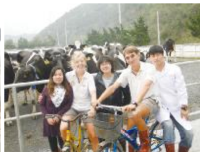
骑着正兴牧业的自行车逛牛场