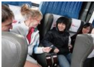
在颠簸的汽车上采访交流