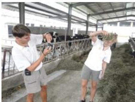
看看中国牛场向草饲料的情况