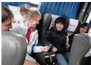
在颠簸的汽车上采访交流